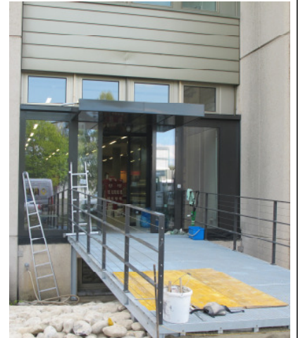
Büroinbau und Showroom Bassersdorf, ZH