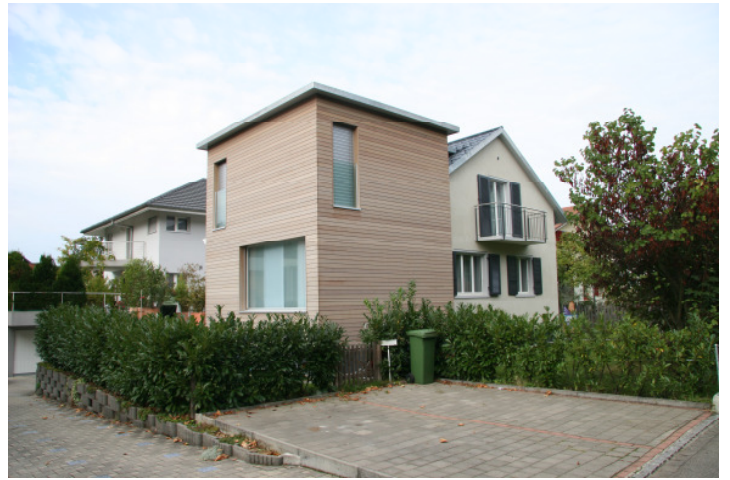
Anbau Aesch, BL