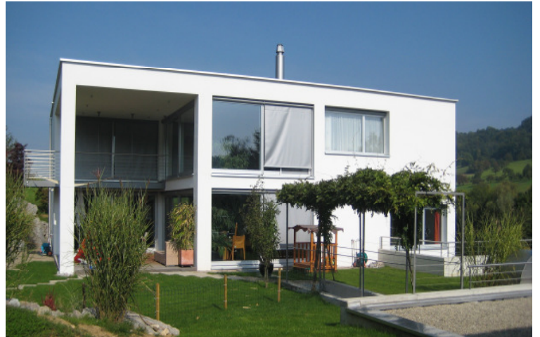
Einfamilienhaus Zuzgen, BL