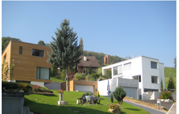
Einfamilienhaus Zuzgen, BL