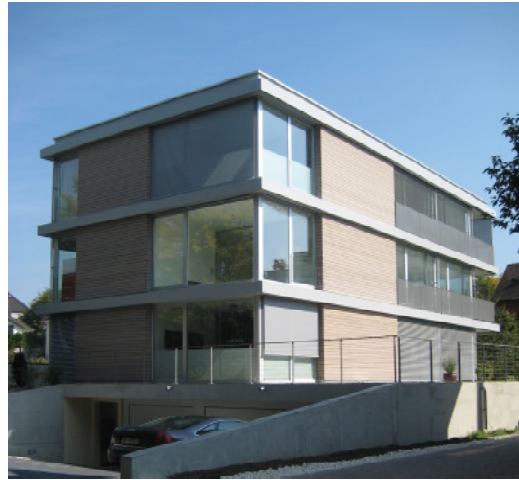
Mehrfamilienhaus Oberwil, BL